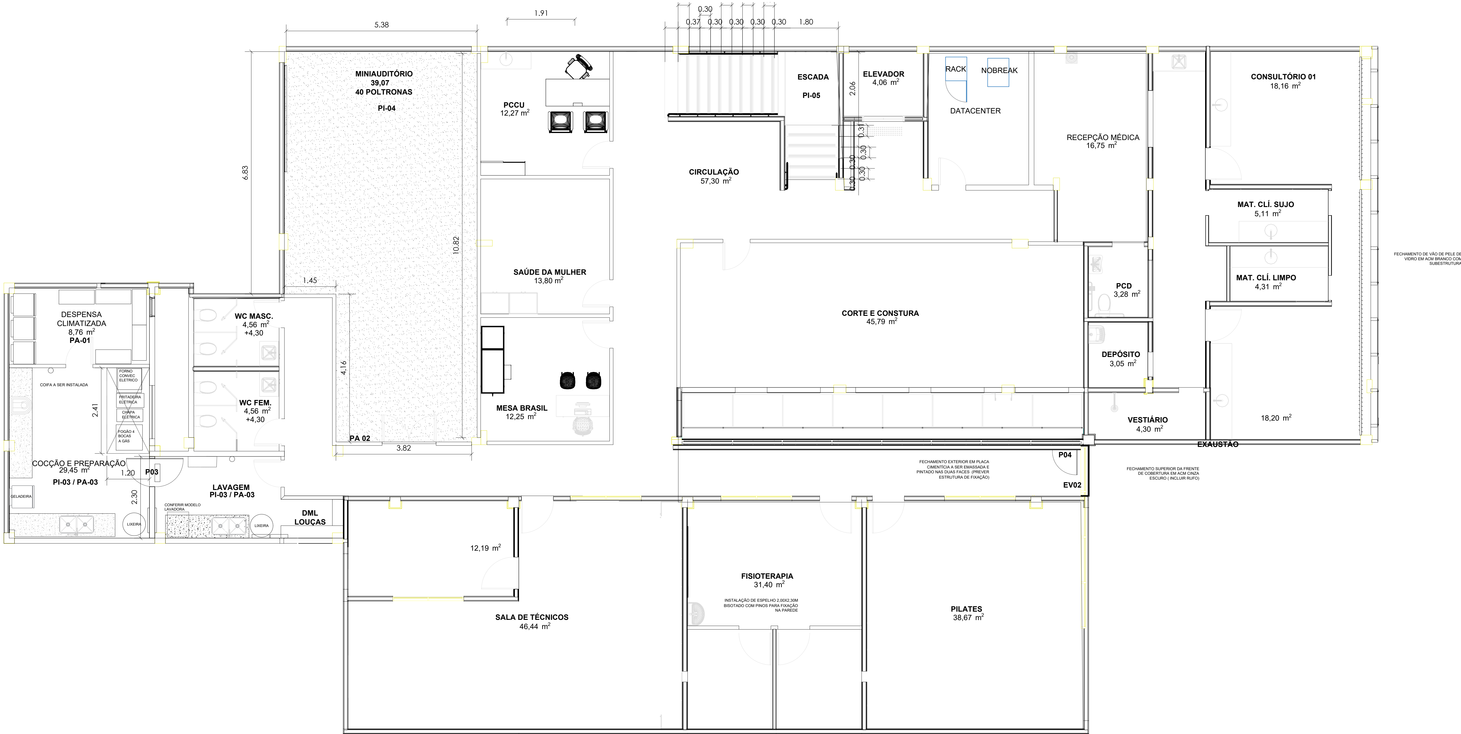
PLANTA BAIXA - 1º PAVIMENTO ESCALA