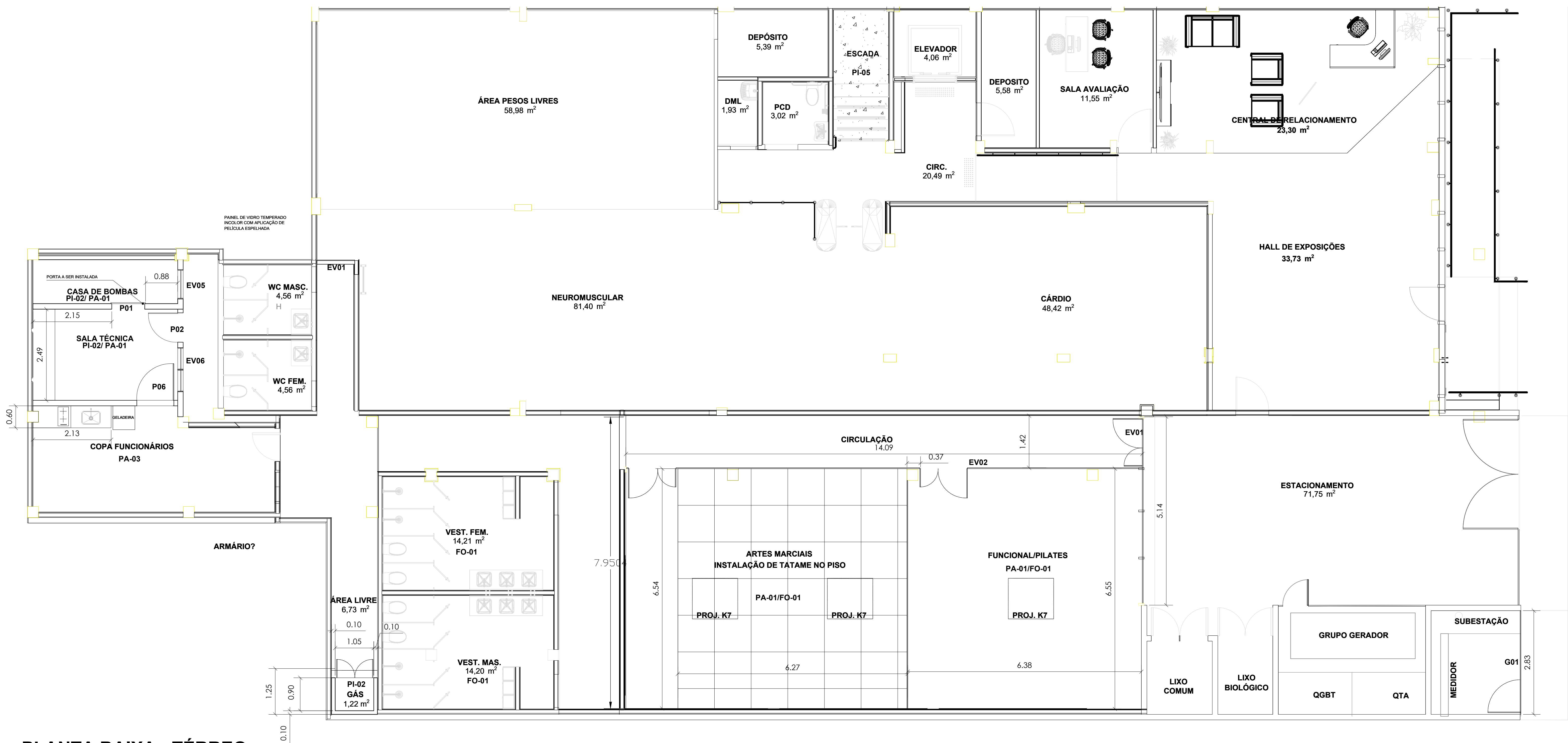
PLANTA BAIXA - TÉRREO ESCALA